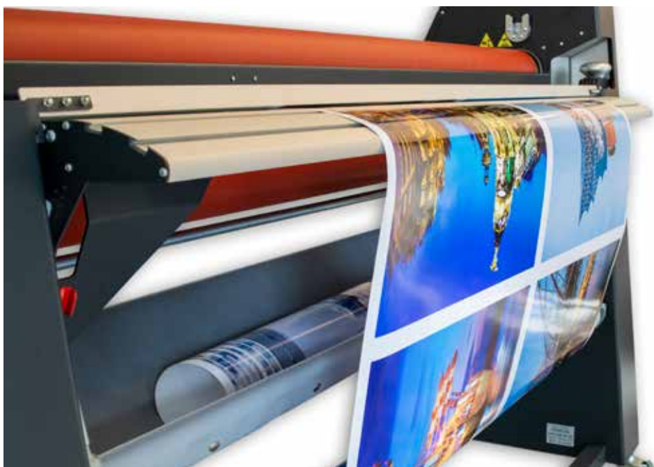
Roll to roll laminácia vďaka integrovanému navíjaču