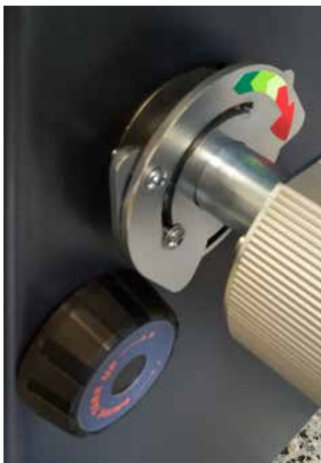
Brzdy a spojky pre všetky osi